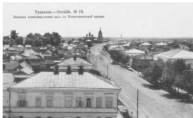
Ил. 2. Большая Александровская вид с Петропавловской церкви. Изд. Контрагентства А.С. Суворина и К