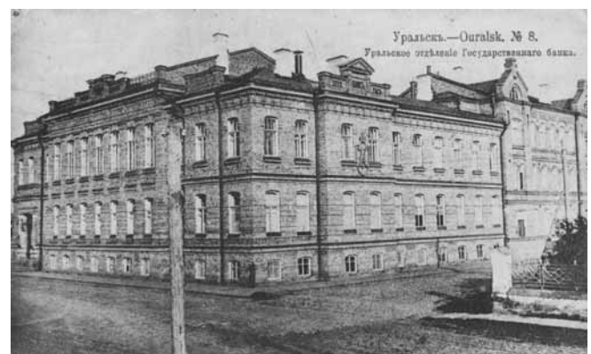
Ил. 18. Уральское отделение Государственного банка. Изд. Контрагентства А.С. Суворина и К.

По правую сторону был Александро-Невский собор, не сохранившийся до наших дней, за которым располагалось Уральское отделение государственного банка (Ил. 18). Здание банка было построено в 1912 г. по проекту архитектора М. Клементьева. До сих пор на фронте сохранились надписи “Государственный банк. Уральское отделение” и