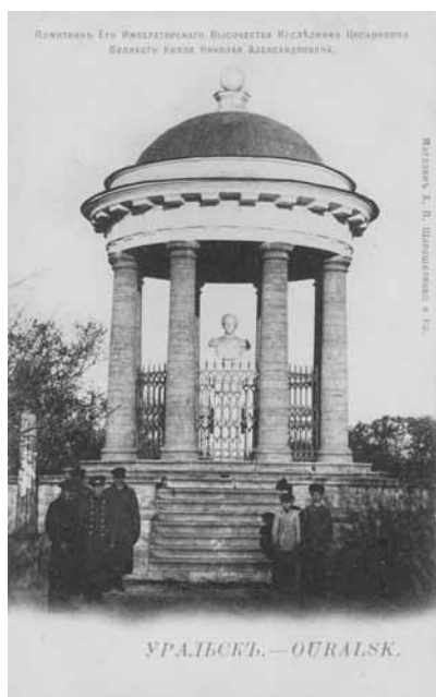
Ил. 11. Памятник на Столыпинском бульваре.

ское правление. Здание сохранилось и сейчас — в нём находится средняя школа. По правую сторону от Казанской площади, сразу за Казанской церковью, находилась одна из достопримечательностей города — Столыпинский бульвар (Ил. 8). Созданный в 1859 г. по инициативе наказного атамана А.Д. Столыпина на месте болота, первый в городе бульвар стал любимым местом отдыха горожан. Здесь часто играл оркестр, проходили гуляния и праздники, чествования героев военных кампаний, в частности, Хивинского похода 1873 г. и русско-турецкой войны 1877-78 гг. В 1860 г. в центре бульвара построили ротонду, а в 1867 г. «от верных уральцев» в ротонде установили мраморный бюст безвременно скончавшегося в 1865 г. наследника престола, атамана всех казачьих войск цесаревича Николая Александровича (Ил. 11). После революции бюст убрали, а ротонда сохранилась до наших дней. В западной части бульвара находилось зда-