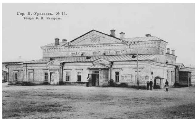
Ил. 23. Театр Ф.И.Макарова. Изд. Бр. Кузнецовых