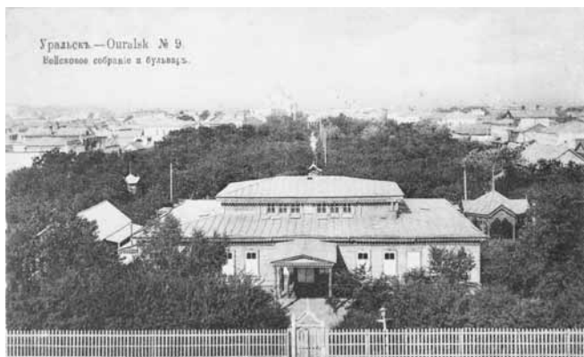
Ил. 9. Военное собрание и бульвар. Изд. Контрагенства А.С. Суворина и К