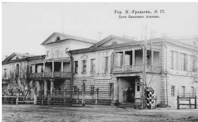
Ил. 14. Дом Наказного Атамана. Изд. Бр. Кузнецовых