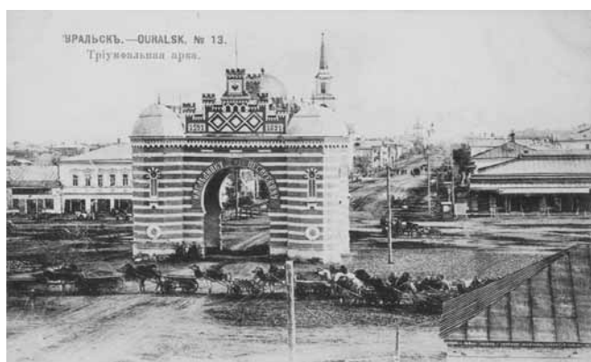
Ил. 21. Триумфальная арка.