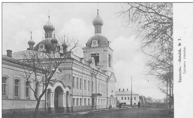
Ил. 5. Духовное училище. Изд. маг. А.П. Шапошникова в Уральске