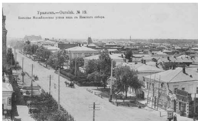
Ил. 19. Большая Михайловская улица вид с Невского собора. Изд. Контрагентства А.С. Суворина и К

“Банк 1912 год”. Сейчас здесь расположен Департамент Казначейства Западно-Казахстанской области.