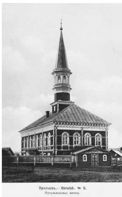
Ил. 12. Мусульманская мечеть. Изд. маг. А.П. Шапошникова в Уральске