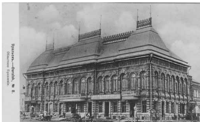
Ил. 7. Областное Правление. Изд. маг. А.П. Шапошникова в Уральске