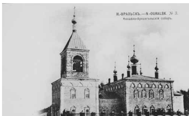
Ил. 3. Михайло-Архангельский собор. Изд. Маг. Е.Л. Кузнецовой