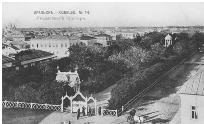
Ил. 8. Столыпинский бульвар. Изд. Магазина А.П. Шапошникова и К