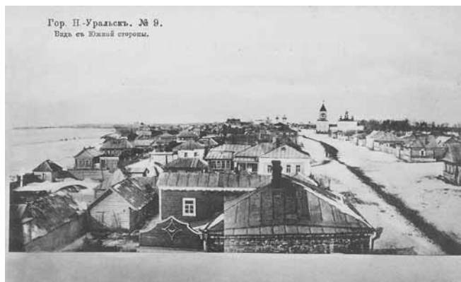
Ил. 1. Вид с Южной стороны.