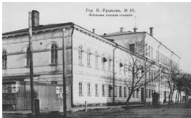
Ил. 6. Войсковая женская гимназия. Изд. Бр. Кузнецовых