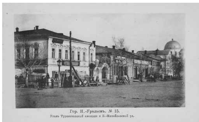
Ил. 20. Угол Туркестанской площади и Б.-Михайловской улицы. Изд. Бр. Кузнецовых

соль от депутации города. Символично, что арка была установлена на месте казни казаков в 1803 г. за отказ подчиниться царскому указу. Ее разрушили в 1927 г. По левую сторону площади располагался Торгово-Промышленный Коммерческий банк (Ил. 22). Построили его в 1905 г. по проекту архитектора А. Бунькина. Слева и справа над входом установили скульптуры воина и рыбака, как символы основных занятий казачьего войска. В 30-х гг. XX века казаков заменили на скульптуры сельских тружеников. Здание сохранилось и сейчас в нём располагается областная администрация. На Туркестанской площади находился театр, построенный в 1889 г. купцом-меценатом Ф.И. Макаровым (Ил. 23). Это был уже третий театр, созданный в Уральске. Первый организовали в 1858 г. при содействии наказного атамана А.Д. Столыпина. На сцене макаровского театра в 1891 г. выступал Ф.И. Шаляпин. В Гражданскую войну здание пострадало при артобстреле, и позднее было разобрано.