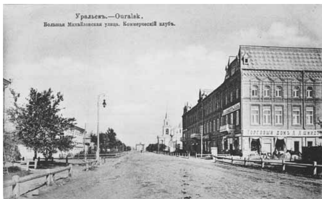
Ил. 15. Большая Михайловская улица. Коммерческий клуб. Изд. маг. А.П. Шапошникова и К