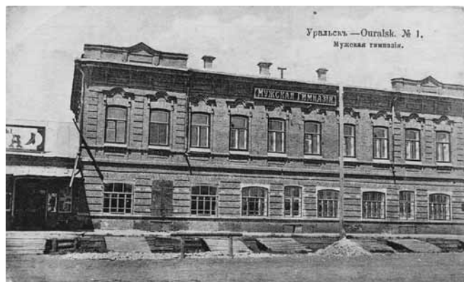
Ил. 25. Мужская гимназия. Изд. Контрагентства А.С.Суворина и К