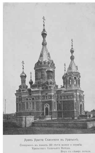
Ил. 13. Храм Христа Спасителя в Уральске.

этой церкви 1 февраля 1774 г. венчался Е. Пугачёв с уральской казачкой, красавицей Устиньей Кузнецовой. С противоположной стороны площади к церкви примыкало духовное училище (Ил. 5), связанное с именем писателя В.П. Правдухина. Здание духовного училища сохранилось, но до неузнаваемости перестроено под гостиницу, а церковь была разрушена в 1936 г. На противоположной стороне улицы находилась войсковая женская гимназия, построенная в 1836 г. (Ил. 6). Её выпускницами были девушки самых известных фамилий Уральска: Бородиных, Каревых, Толстовых, Мартыновых. Дом сохранился до настоящего времени и теперь в нём находится один из факультетов местного университета.