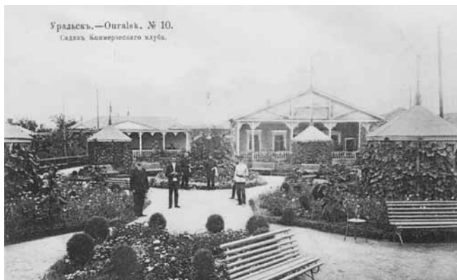
Ил. 16. Садик Коммерческого клуба. Изд. маг. А.П. Шапошникова