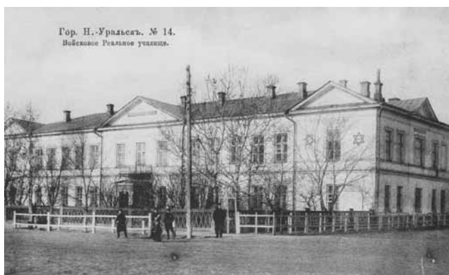
Ил. 17. Войсковое Реальное училище. Изд. Бр. Кузнецовых

Р.У. Хайруллиним и передано верующим. Им же был организован и финансируется музей Г. Тукая.