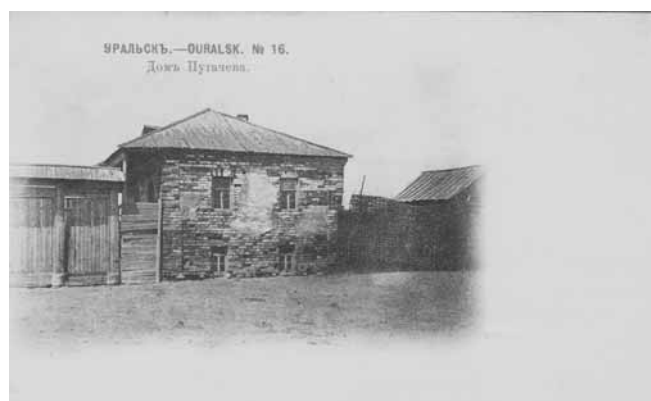
Ил. 4. Дом Пугачева. Изд. Магазины А.П. Шапошникова и К