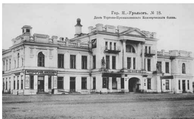
Ил. 22. Дом Торгово-Промышленного Коммерческого банка. Изд. Бр. Кузнецовых

Следуя далее по Большой Садовой, мы увидим справа одну из достопримечательностей города — храм Христа Спасителя, сооружённый в память