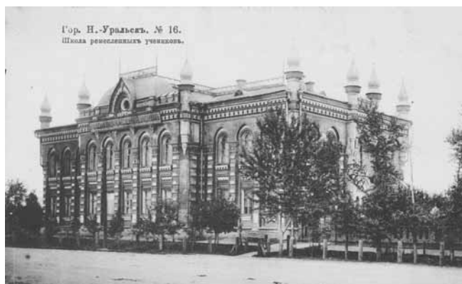
Ил. 24. Школа ремесленных учеников. Изд. Бр. Кузнецовых